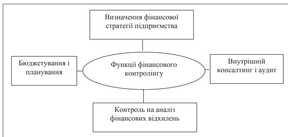
Рис. 1. Основні функції фінансового контролінгу підприємств малого бізнесу

Кожний із цих розділів містить певні цілі, які формуються для підприємств малого бізнесу з урахуванням специфічних особливостей їх розвитку. Основним завданням контролінгу малого бізнесу є постійна орієнтація системи управління підприємством на досягнення поставлених цілей.