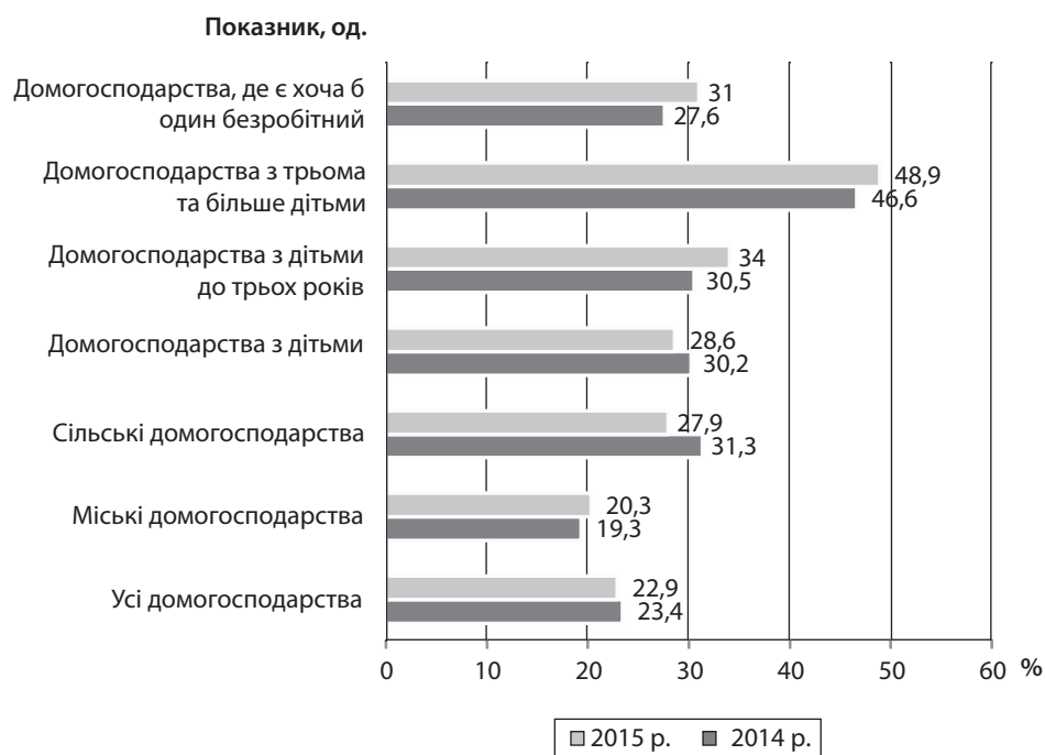
Рис. 2. Рівень відносної бідності, %

До категорії бідних за умовами життя у 2015 р. були віднесені домогосподарства, які мають 10 і більше ознак позбавлення із 33 ознак. Базовий список позбавлень (депривацій) був визначений Держстатом за участю фахівців Інституту демографії та соціальних дослі-