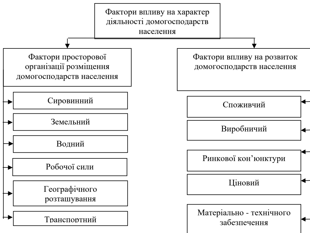
Рис. 4. Фактори організації і функціонування домогосподарств населення