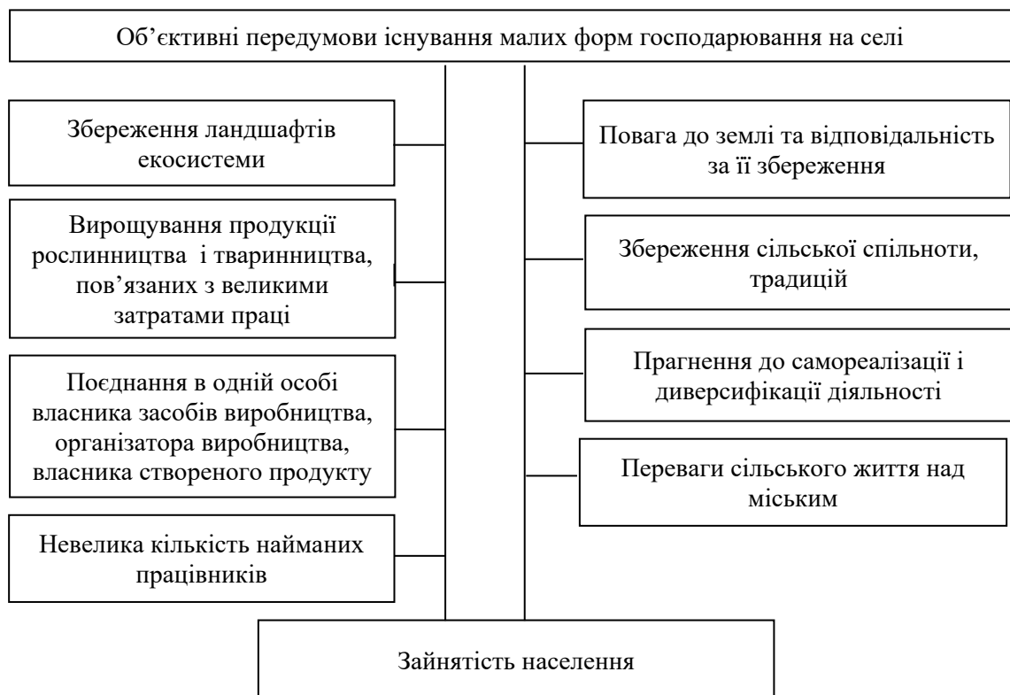
Рис. 1. Об'єктивні передумови розвитку малих форм господарювання на селі

Виклад основного матеріалу дослідження. Вихідними положеннями для дослідження цього питання є визначення і обґрунтування передумов існування домогосподарств населення в системі вже існуючих форм господарювання в АПК. Об'єктивний підхід дозволяє виокремити низку важливих обставин (рис. 1).