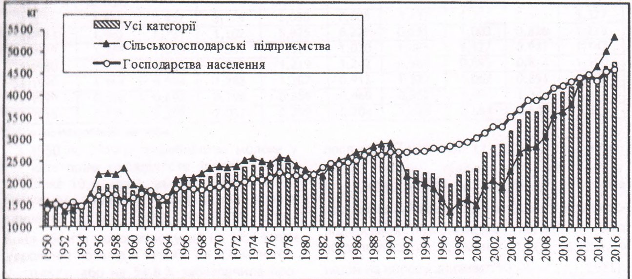
Рис. 2. Продуктивність корів у сільському господарстві України в динаміці

Загалом продуктивність корів у динаміці має тенденцію до зростання. Якщо у 1950 р. надій на корову становив 1418,7 кг, 1963 р. - 1564,0, 1970 р. - 2214,1, 1980 р. - 2272,8, 1999 р. - 2287,7, то у 2016 р. досяг 4794,2 кг (рис. 2).