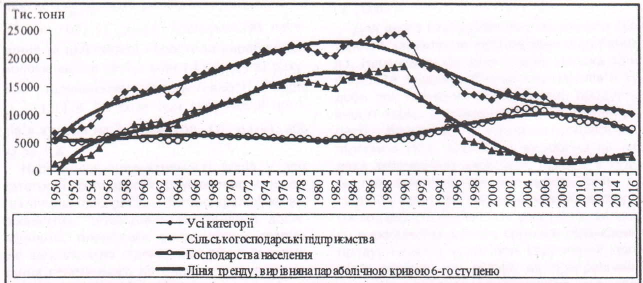
Рис. 3. Динаміка виробництва молока у сільському господарстві України*

лення відзначається рівномірністю зростання. Зміни у поголів'ї й продуктивності тварин відповідно зумовлюють коливання обсягів виробництва молока (рис. 3).