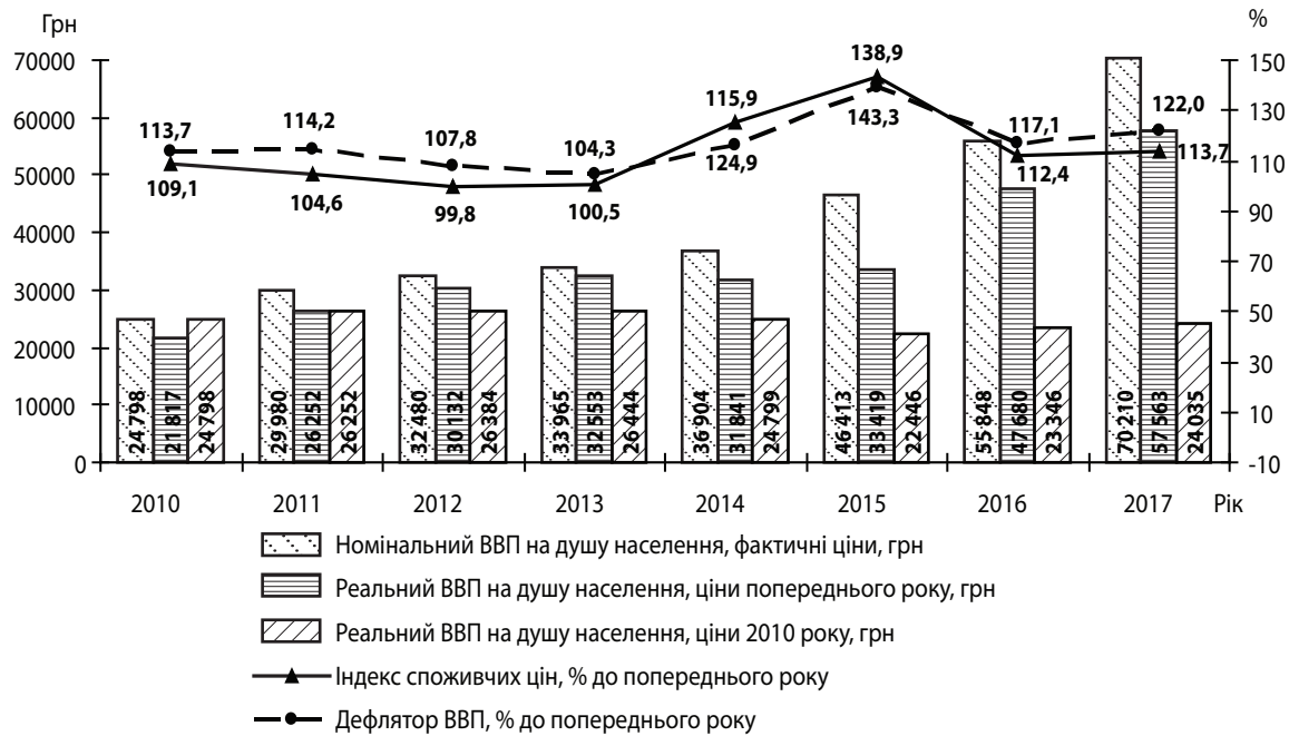
Рис. 2. Динаміка номінального і реального ВВП в розрахунку на душу населення та коливання цінних індексів в Україні протягом 2010–2017 рр. (без урахування тимчасово окупованої території АРК і частини Донецької і Луганської областей в зоні проведення АТО)