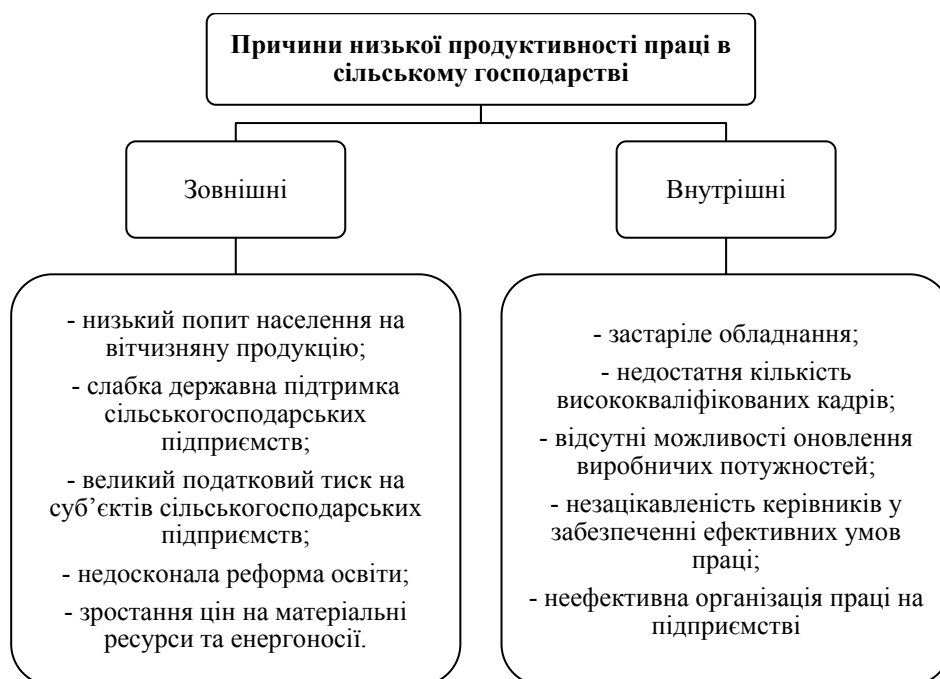
Рис. 2. Причини низької продуктивності праці в сільському господарстві