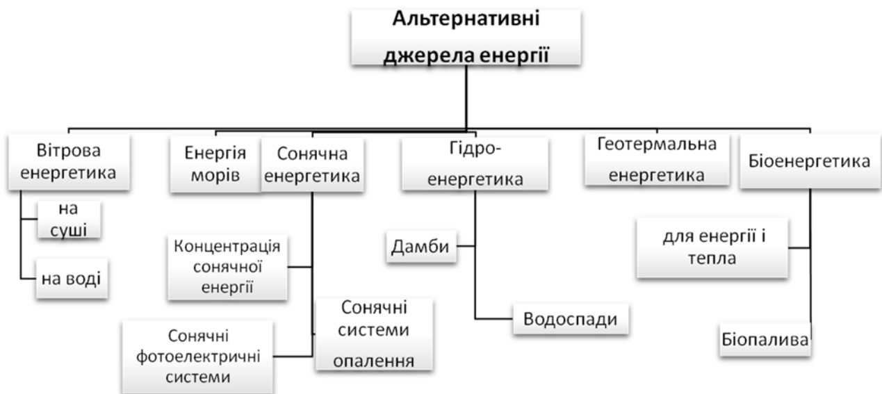
Рис. 2. Огляд технологій використання поновлюваних джерел енергії

споживання цього виду енергії. На нашій території можна виробляти майже всі види альтернативної енергетики (рис. 2).