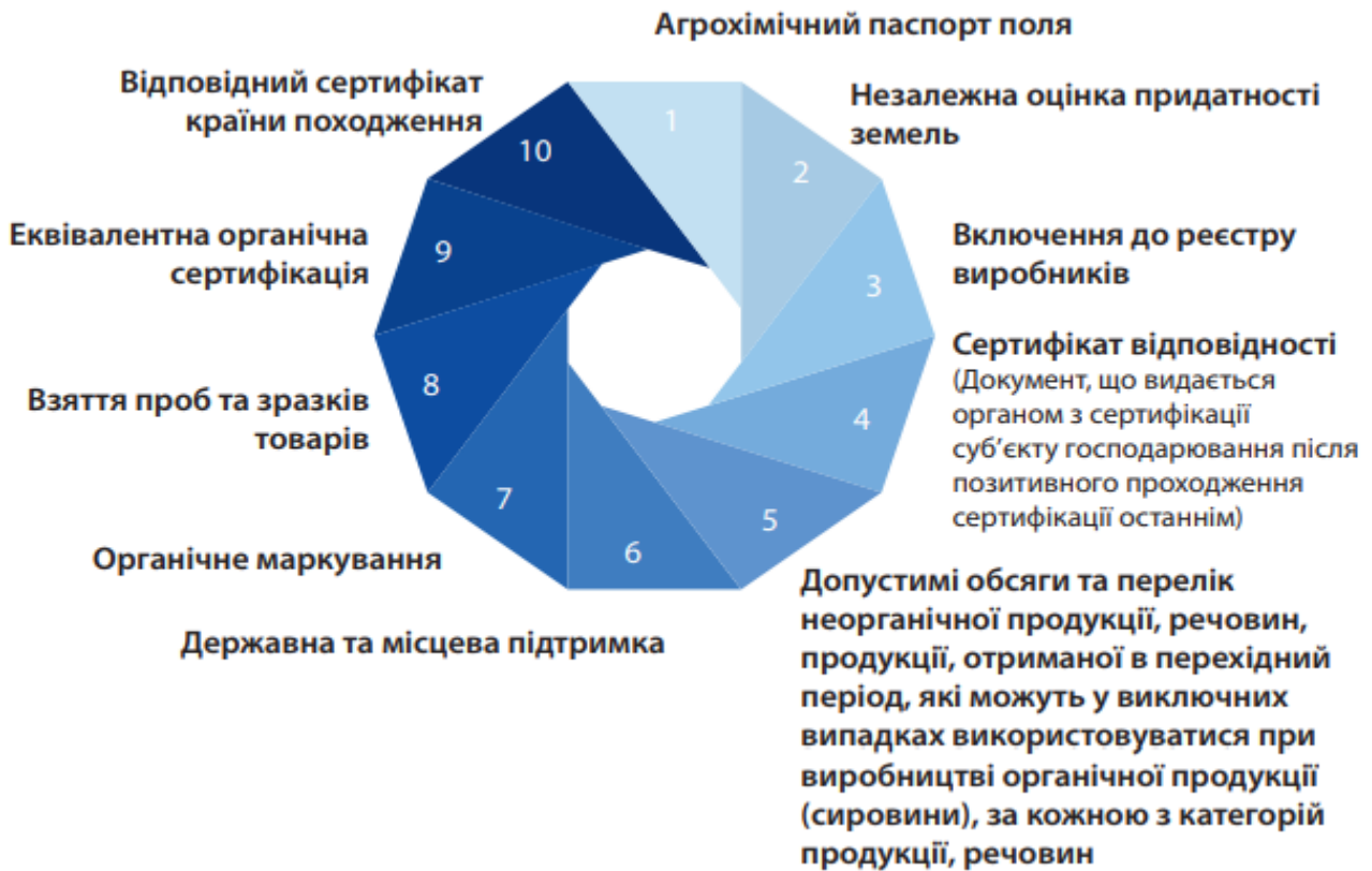
Рис. 1. Інструменти регулювання органічного ринку