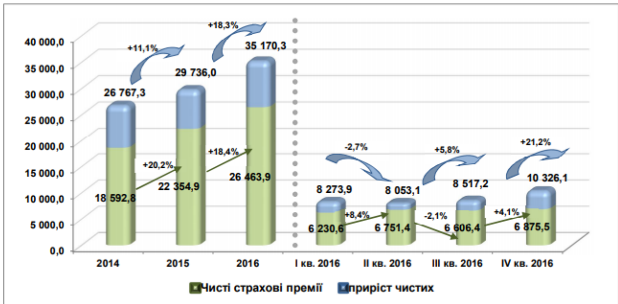
Рис.2. Динаміка страхових премій за 2014-2016 рр.

*Джерело: розроблено автором на основі [2]