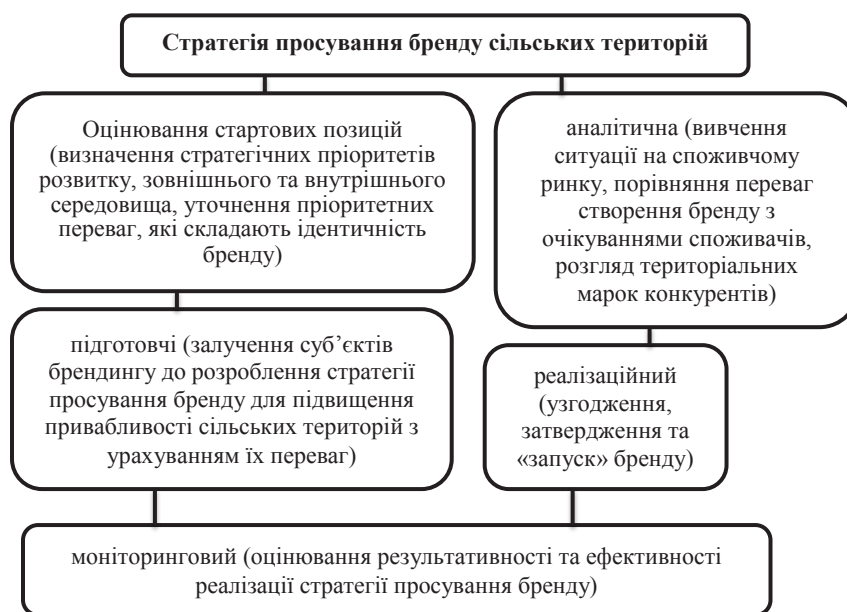
Рис. 4. Стратегія просування бренду сільських територій

Родзинкою Вінницького регіону є оздоровчі санаторії в таких містах, як Хмільник, Немирів, Вінниця, адже