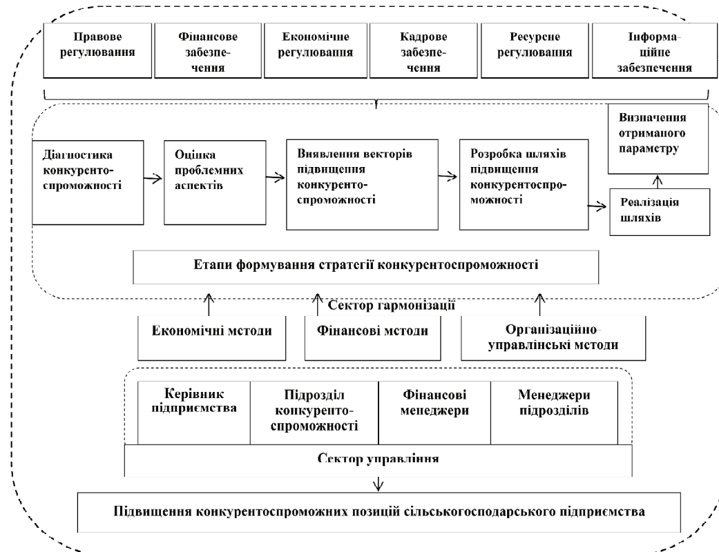
Рис. 2. Етапи формування стратегії конкурентоспроможності сільськогосподарських підприємств

нології, які можна застосувати в своїй роботі, або отримання їхньої частки в перспективному стартапі.