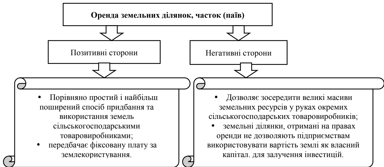
Рис. 2. Порівняльна характеристика оренди земельних ділянок, часток (паїв)

Підсумовуючи результати проведення земельної реформи та аналізу використання земель сільськогосподарського призначення можна відмітити й позитивні зміни (табл. 3).