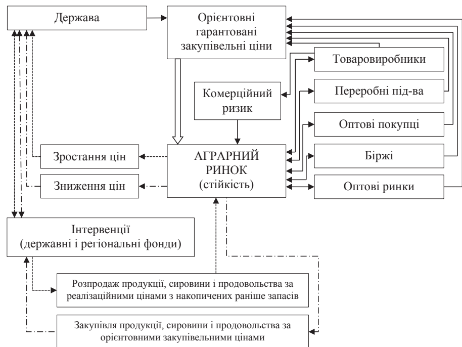
Рис. 3. Державне регулювання цін на аграрному ринку для забезпечення стійкості його розвитку