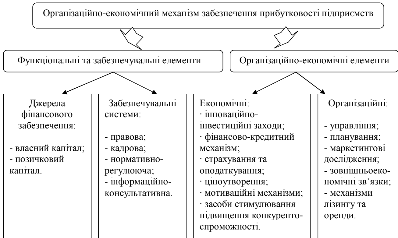
Рис. 1. Організаційно-економічний механізм забезпечення прибутковості підприємств [2, с. 75]

Економічні важелі впливу включають: інноваційно-інвестиційні заходи, фінансово-кредитний механізм регулювання, страхування та оподаткування, ціноутворення, мотиваційні механізми, засоби стимулювання на шляху підвищення конкурентоспроможності підприємства.