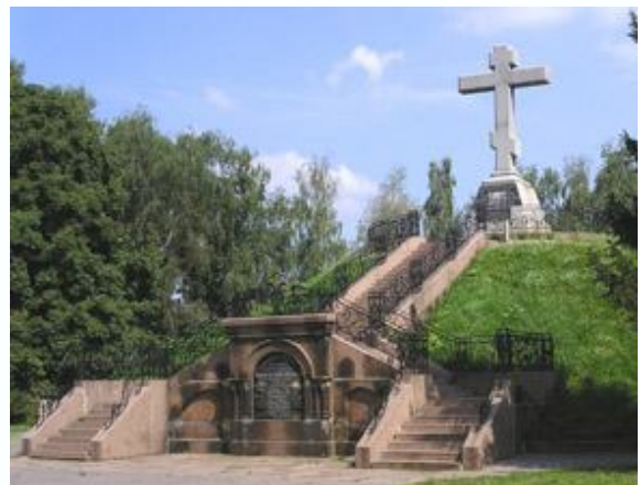
Рис. 2. Братська могила російських воїнів

Наступного дня після Полтавської битви, цар Петро I наказав вирити дві могили: одну для загиблих офіцерів і одну для солдатів. У присутності усіх військ була відслужена панахида, а після поховання, над могилою, був насипаний великий пагорб, який названий Братською могилою російських воїнів . За легендою, російський цар власноруч встановив на його вершині дерев'яний хрест із написом: "Воины благочестивые, за благочестіе кровію вьнчавшіеся, льта оть воплощенія Бога-Слова 1709, іюня 27 дня".