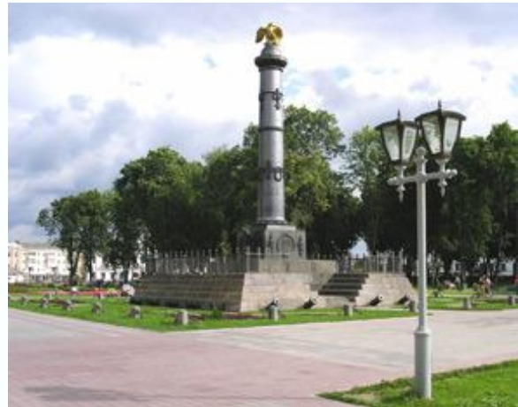
Рис. 1. Пам'ятник Слави

Пам'ятник Слави є однією з визначних пам'яток центральної частини Полтави. Він був встановлений на місці, де після Полтавської битви 27 червня 1709 року відбулася зустріч царя Петра I з гарнізоном фортеці і цивільним населенням Полтави.