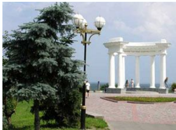
Рис. 4. Біла альтанка

1941-1943р. альтанка була зруйнована, тому що на її місці улаштували спостережний артилерійський пункт. У 1954 році на цьому місці була урочисто відкрита "Ротонда дружби народів", побудована за проектом архітектора Л.С.Вайнгорта. З місця, на якому вона встановлена, відкривається чудовий краєвид на околиці Полтави і Хрестовоздвиженський монастир. Цей оглядовий майданчик - одне з найулюбленіших місць туристів і гостей міста. Неподалік від альтанки знаходиться меморіальний камінь з висіченими на ньому словами з Іпатіївського літопису - документу, в якому в 1074р. було зроблено запис, де вперше згадувалось місто Полтава.