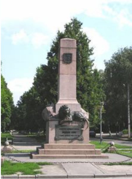
Рис. 3. Пам'ятник коменданту фортеці "Полтава" полковнику Келіну

Пам'ятник коменданту фортеці "Полтава" полковнику Келіну і її захисникам був споруджений на місці одного з бастіонів Полтавської фортеці за проектом генерала від кавалерії, барона Олександра Олександровича Більдерлінга. На постаменті пам'ятника лежить бронзовий лев, під яким зроблено напис: "Доблестному коменданту Полтавы полковнику Келину и славным защитникам города в 1709 году". З протилежного боку пам'ятника розміщено текст, що розповідає про події, пов'язані з облогою фортеці Полтава шведською армією Карла XII у квітні-червні 1709 року.