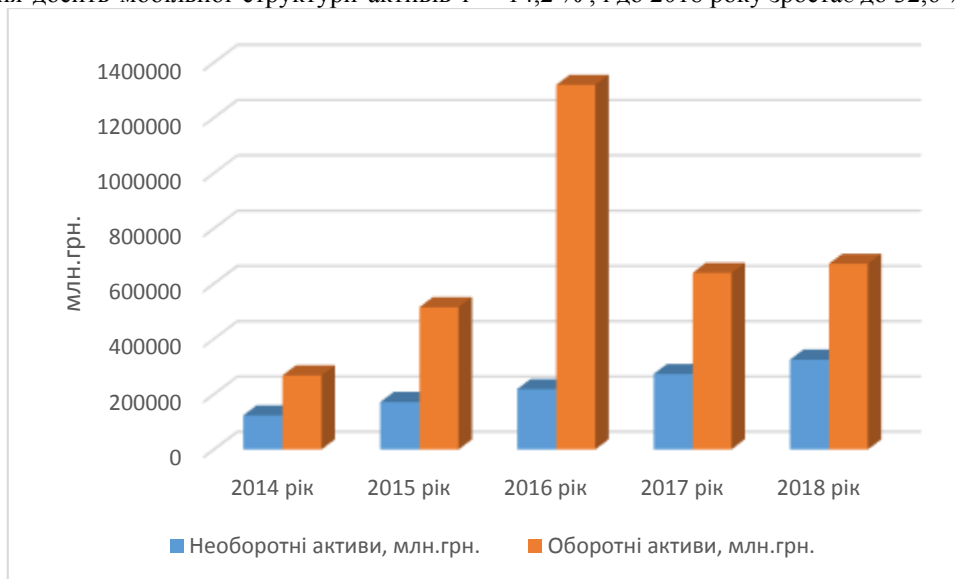
Рис. 1 Динаміка структури активів сільськогосподарських підприємств України за 2014-2018 роки

прискорену оборотність, наявність значних сум дебіторської заборгованості за товари, роботу і послуги. Частка ж необоротних активів у загальній вартості активів сільськогосподарських підприємств за період 2014-2016 роки зменшується від 31,5 % до 14,2 % , і до 2018 року зростає до 32,6 %.