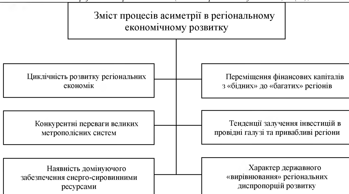
Рис. 1. Змістовна характеристика причин існування асиметрії розвитку регіональних економічних систем.

В сукупності вище визначених причин асиметрії розвитку регіонів принципово важливим є обґрунтувати сутність циклів ділової активності. Ця проблема зафіксована в багатьох наукових дослідженнях.