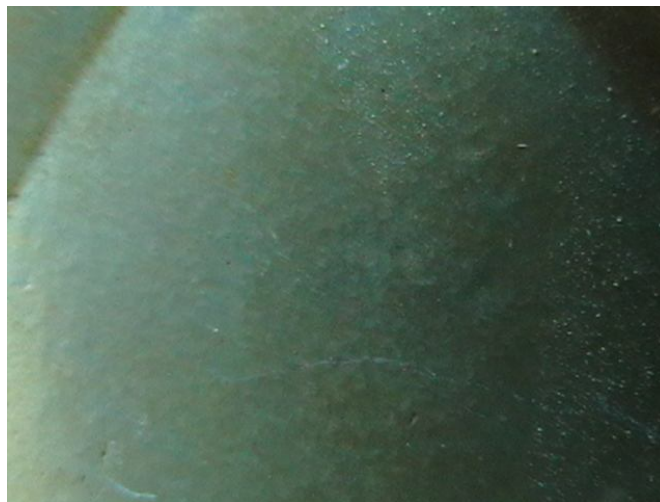
Рис. 1. Оксидное покрытие модифицированное таннином, полученное вибрационным способом после 685 часов коррозионных испытаний в 3%-ном растворе хлорида натрия. Материал образцов АДО

Работы, проведенные нами по модификации оксидирующего раствора, показали положительные результаты. Так, при введении в оксидирующий раствор таннина, в количестве 0,5 г. на литр, антикоррозионные свойства покрытия значительно возросли. Можно предположить, что таннин гидролизуясь в растворе переходит в галловую кислоту, которая, взаимодействуя с оксидом алюминия, образует соединения, способствующие повышению коррозионной стойкости покрытия. Есть сведения о том, что таннин способствует повышению электрической прочности покрытия. На рис. 1 представлено оксидное покрытие, модифицированное таннином после коррозионных испытаний в 3-х % растворе хлорида натрия.