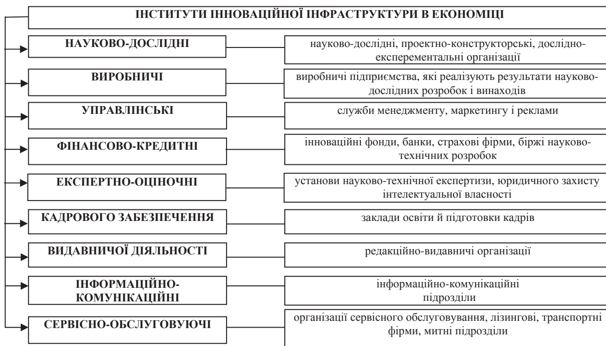
Рис. 1. Об'єкти інфраструктурного забезпечення формування інтелектуального капіталу і розвитку-поширення інновацій в національній економіці*