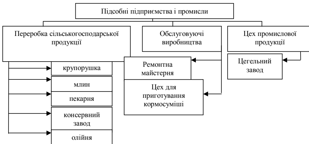
Рис. 1. Підсобні виробництва і промисли сільськогосподарських підприємств Вінниччини

Адже за допомогою цієї сфери виробництва змінюється характер сільськогосподарської праці, відбувається перетворення її на різновид індустріальної; раціональніше використовуються трудові ресурси, особливо резерви їх у міжсезонні періоди; поліпшується соціально-демографічна ситуація на селі; підвищуються культурно-побутові умови життя сільських працівників; розвивається інфраструктура села. Крім раціоналізації зайнятості великої уваги потребує і вдосконалення підбору і розстановки кадрів в господарстві.