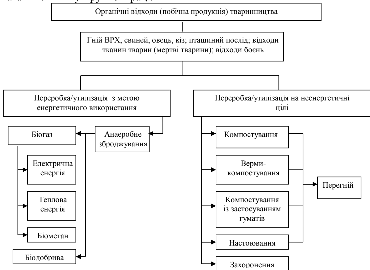
Рис. 2. Найбільш поширені методи переробки органічних відходів (побічної продукції) тваринництва та вторинна продукція, що при цьому отримується

транспортування, різний розмір шматків, необхідність попереднього підготування палива до спалювання, наявність домішок та неорганічних забруднень, високу зольність спалювання та його низьку ефективність. Натомість, перевагами використання рослинних решток для виробництва твердого біопалива з подальшим спалюванням для отримання теплової енергії є: більша ефективність, екологічна чистота спалювання; зручність і тривалий термін зберігання; більш широкий спектр сировини для виробництва; повна готовність до використання, яке може бути повністю автоматизоване і вимагатиме мінімум ручної праці.