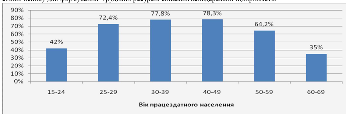
Рис.3.Рівень зайнятості населення за віковими групами,% до загальної чисельності населення відповідної вікової групи

Молодь залишає сільську місцевість, не бажає працювати в аграрному секторі, відаючи перевагу іншим галузям економіки, чим спричиняє старіння та зменшення чисельності сільського населення, яке являє собою основу для формування трудових ресурсів сільськогосподарських підприємств.