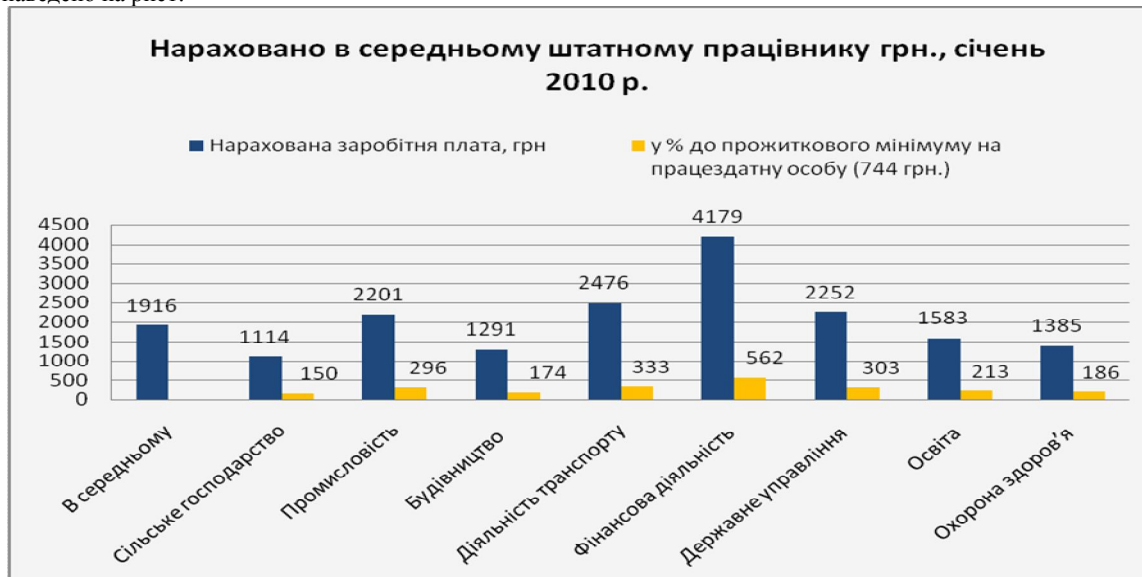
Рис. 1 Розмір заробітної плати за видами економічної діяльності по Україні

Рівень оплати праці в аграрному секторі є чи не найнижчим з поміж інших галузей і становить лише 58,1% середньої заробітної плати по країні, лише в 1,5 рази вищий за прожитковий мінімум, а це не може не вплинути на бажання людей працювати у сільському господарстві, на становище галузі, і зважаючи на те, що ньому зайнято близько 17% населення, а частка у структурі ВВП складає 9,3%, становища всієї економіки України[3]. Це свідчить про те, що в наш час розмір заробітної плати більшою мірою залежить від галузі економіки ніж від трудового навантаження. Дані про розмір заробітної плати за видами економічної діяльності наведено на рис.1.