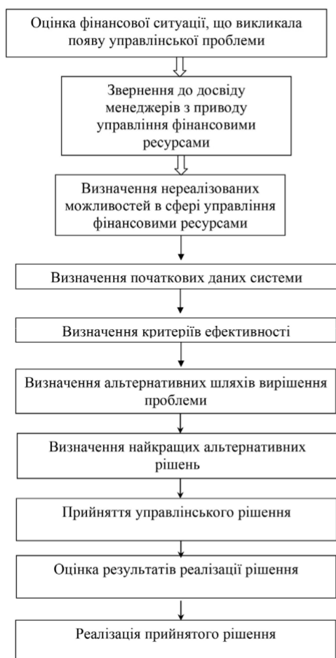
Рис. 1. Система управління фінансовими ресурсами туристичних підприємств