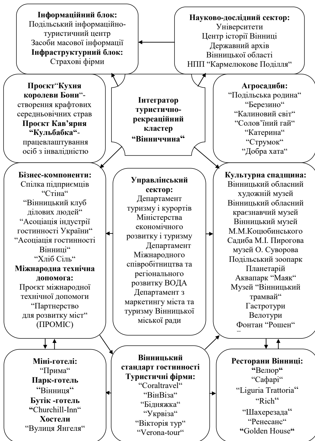
Рис. 2. Проектна модель відносин у туристично-рекреаційному кластері «Вінниччина»