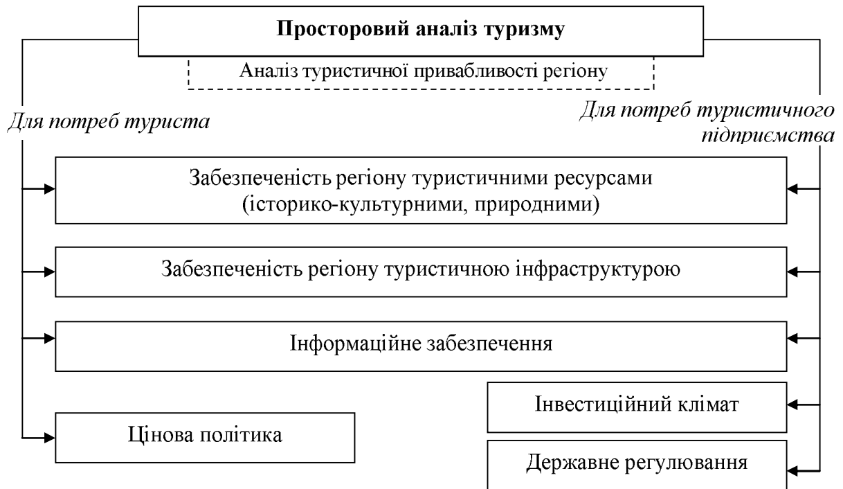
Рис. 4. Особливості просторового аналізу туризму

Порівняльний просторовий аналіз, основу якого становить територіальний аспект – розвиток явищ і процесів за окремими регіонами, і базується в першу чергу на економічному оцінюванні туристичної привабливості регіонів (рис. 4).