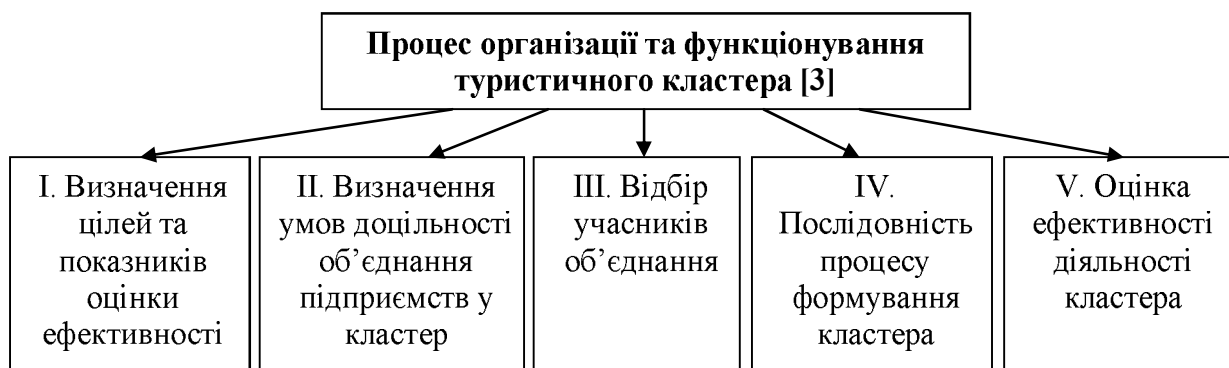
Рис. 3. Модель застосування методу статистичного моделювання та прогнозування процесу організації туристичного кластеру

Так, даний метод актуальний в умовах запровадження кластерної моделі організації туристичного бізнесу, що забезпечить підвищення координації дій всіх суб'єктів галузі та розвиток конкурентних переваг регіону шляхом активізації всіх видів туризму. Саме тому пропонуємо типову модель використання методу статистичного моделювання та прогнозування процесу організації та функціонування туристичного кластеру (рис. 3).