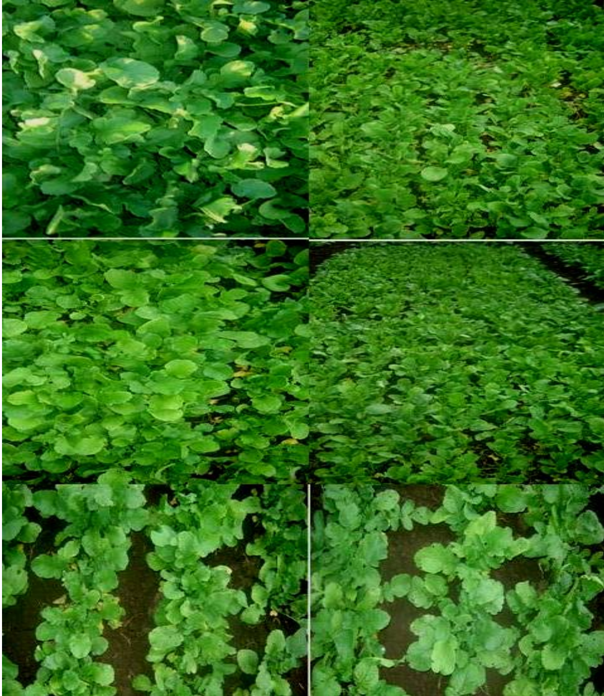
Рис. 2. Характер рослин редьки олійної у фазу розвиненої розетки на фоні передпосівного внесення N_{60}P_{60}K_{60} (зліва – направо: 5, 4, 3, 2 млн шт./га схожих насінин рядковий та 1,5 і 1,0 млн шт./га схожих насінин черезрядний), 2019 рік.

та насіння в умовах 2018 року саме з дефіцитом атмосферного зволоження саме в період травня, тобто на протязі 35–40 діб після застосування мінеральних добрив та активного їх розчинення і формування відповідного статусу мобільності у ґрунтовому розчині тощо.