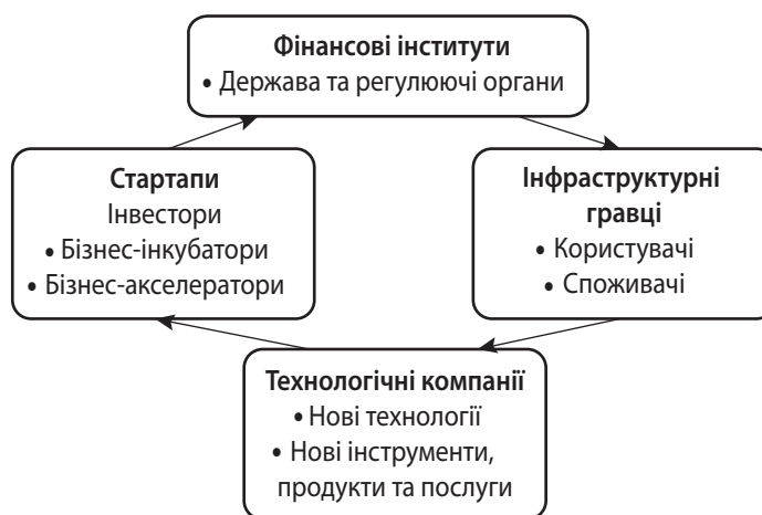
Рис. 1. FinTech як складна екосистема