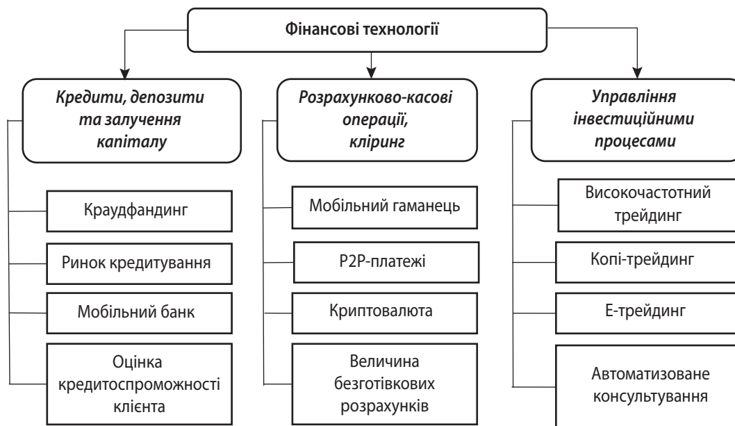
Рис. 3. Класифікація фінтех-продуктів і послуг відповідно до Базельського комітету із питань банківського нагляду [1]

Підсумовуючи проведений аналіз сутності FinTech, вчені визначають такі його ключові характеристики: 1) порівняно зі звичайними фінансовими інноваціями, результатом FinTech інновацій є не лише інноваційні фінансові продукти та технології (процеси), а й нові бізнес-моделі фінансових посередників і ринкові суб'єкти – FinTech компанії; 2) FinTech належить до радикальних інновацій («disruptive technology»), істотно змінює окремі фінансові послуги та ринок фінансових послуг у цілому; 3) обов'язковим базовим концептом, покладеним в основу FinTech інновацій, є інформаційна технологія, часто також інноваційна [2].