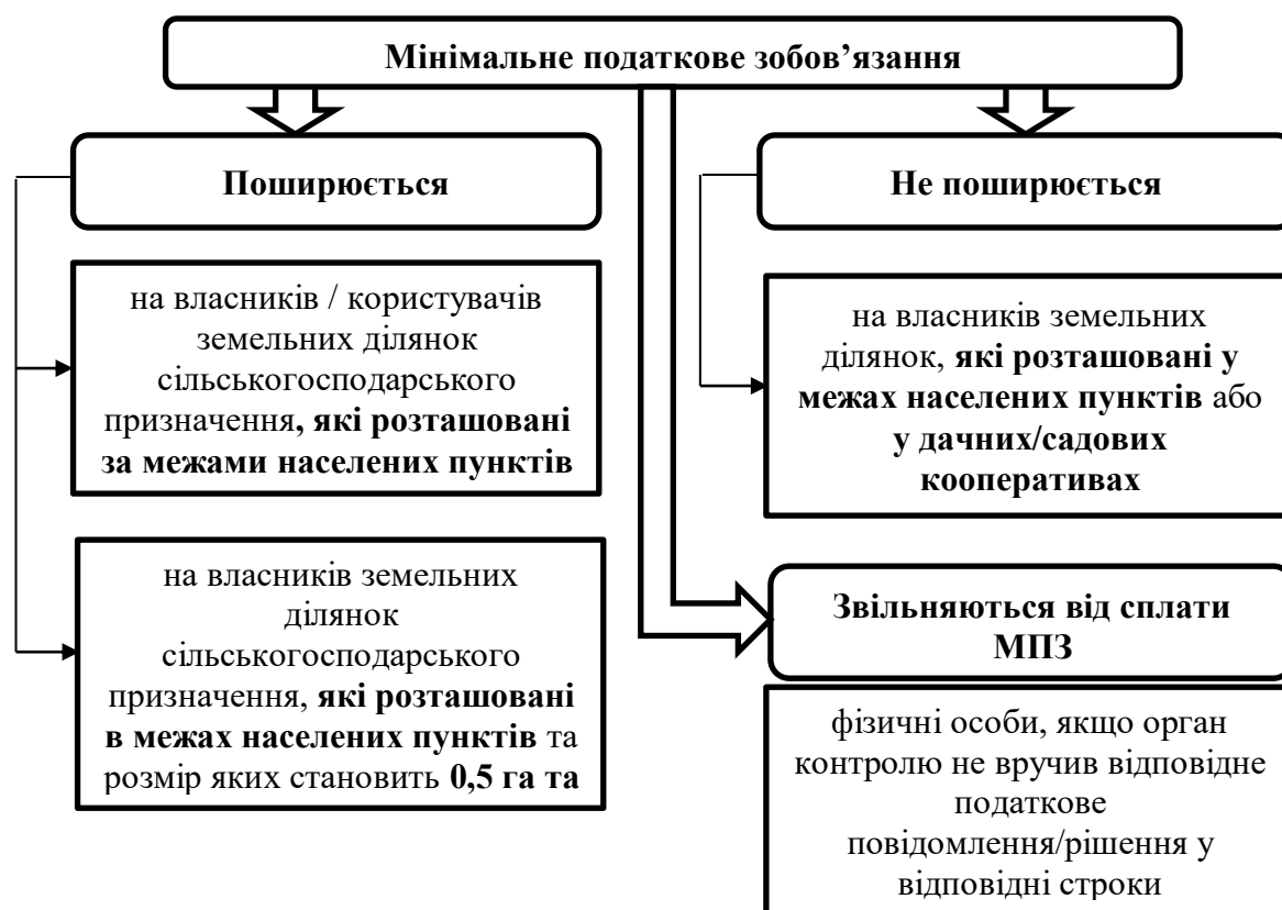
Рис. 2. Застосування мінімального податкового зобов'язання

Мінімальне податкове зобов'язання не визначається для [4]: