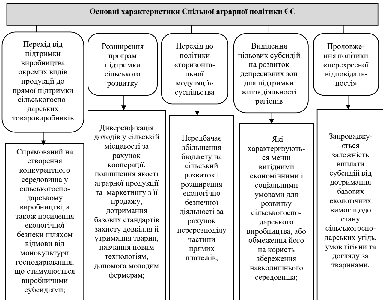
Рис. 1. Основні характеристики Спільної аграрної політики ЄС

періодом (2008-2013 рр.) має відмінні риси та характеристики.