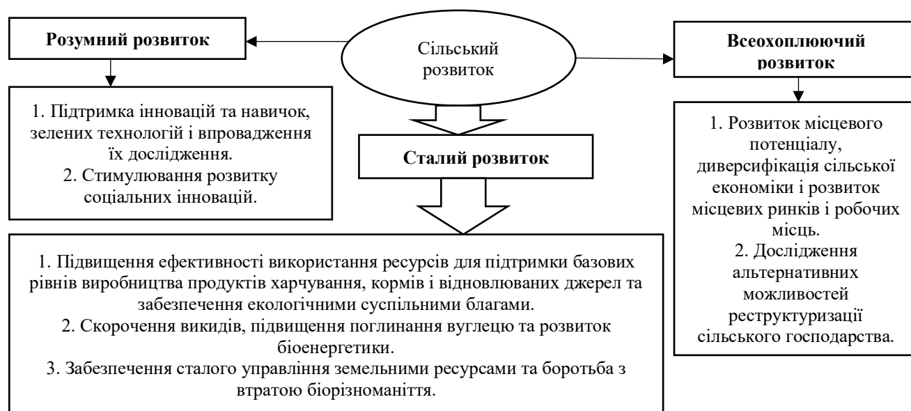
Рис. 2. Сільський розвиток в контексті Стратегії «Європа 2020»

Важливу роль у розвитку країни та реалізації її потенціалу відіграють зовнішньоекономічний вектор, особливості зовнішньої політики, міжнародні торгові партнери та активність взаємодії із ними. Сучасний глобальний економічний простір сприяє інтеграції між країнами як в економічному, так і в політичному сенсі, зміцненню торгових зв'язків, співпраці та кооперації між ними. Ті країни, які залишаються поза цими процесами, не можуть залишатися конкурентоспроможними в довгостроковій перспективі, особливо у випадку невикористаного внутрішнього економічного потенціалу або неефективного його використання. Економічна інтеграція з таким об'єднанням країн, як Європейський Союз, несе в собі значно більший позитивний потенціал, аніж негативний.