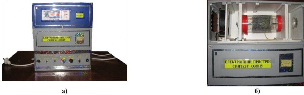
Рис. 2. Електронний пристрій синтезу озону: а) загальний вигляд; б) робоча камера синтезу озону

В нижній частині камери є повітропровід з електричними нагрівальними елементами, через який надходить підігріте повітря і озон, що генерується озонатором, і подається вентилятором з допомогою електродвигуна.