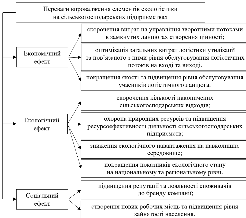
Рис. 3. Переваги провадження елементів екології на сільськогосподарських підприємствах

Лідером на теренах Вінниччини та всієї України з використання принципів екології у впровадженні безвідходних технологій виробництва є біогазовий комплекс МХП, виробничі показники якого щороку зростають. У ході дослідження визначено основні принципи екології, які закладено у діяльність компанії, до яких належать раціональне використання ресурсів; максимальне використання відходів; впровадження інноваційних безвідходних технологій;