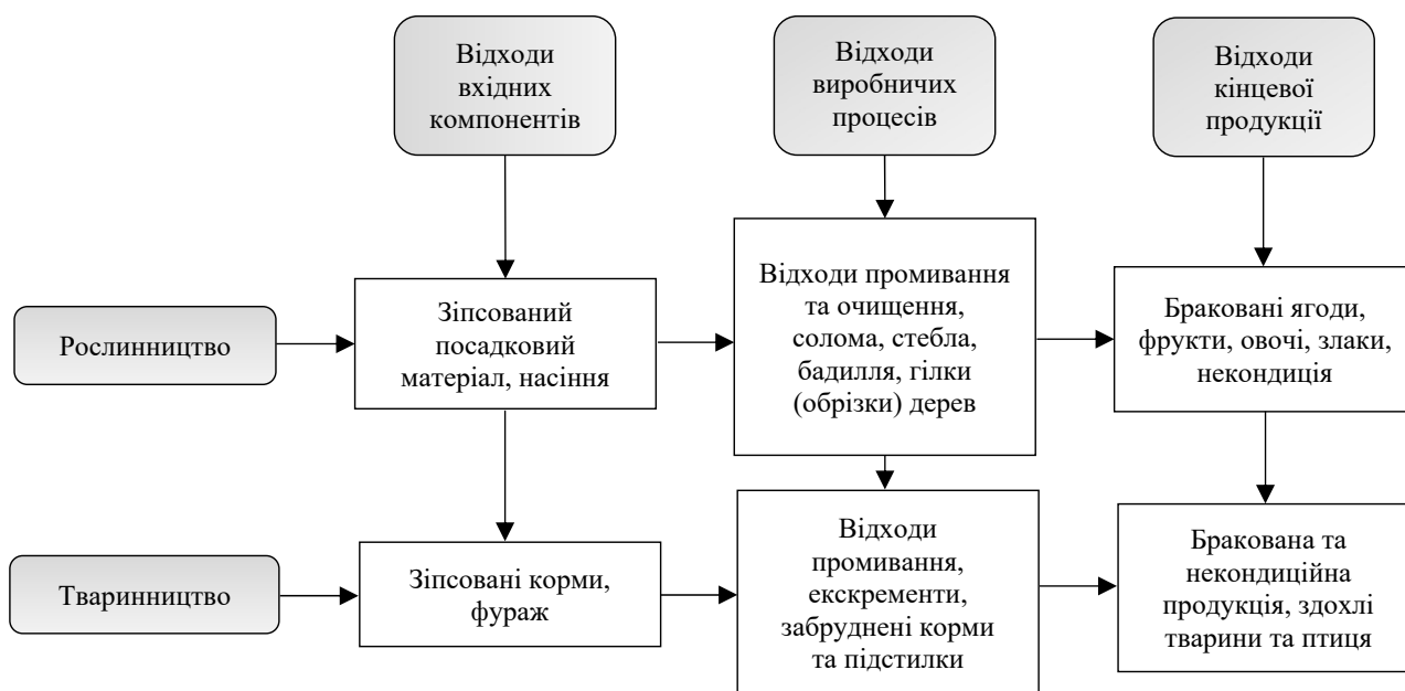
Рис. 1. Сільськогосподарські відходи за джерелами походження