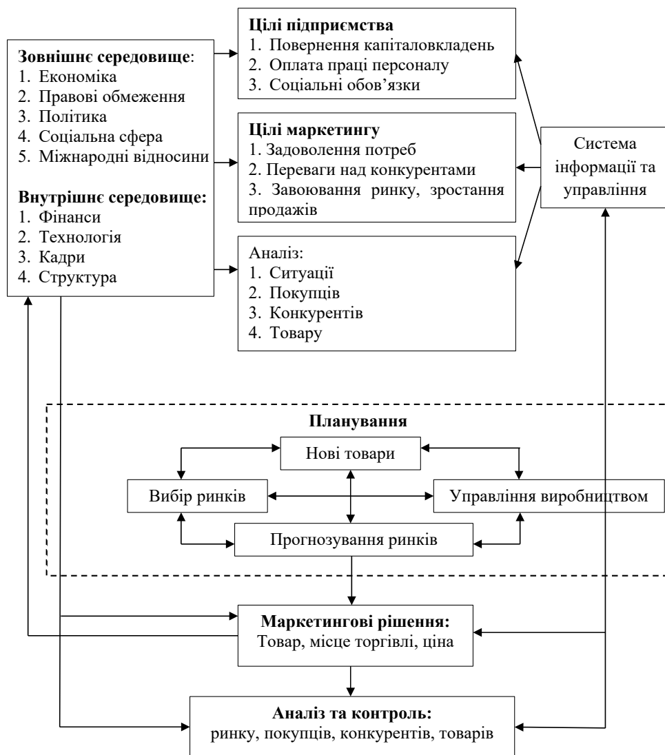
Рис. 3. Модель удосконалення механізму маркетингової діяльності підприємств АПК

Для виконання завдань аналізу, планування та контролю менеджери з маркетингу потребують інформації про зміни в ринковому середовищі.