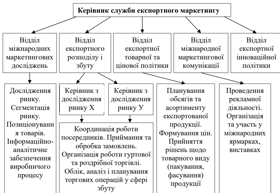
Рис. 1. Схема організації служби експортного маркетингу на підприємствах АПК за ринково-функціональною ознакою

– управління маркетинговою діяльністю (маркетингом) як системою, тобто планування, виконання і контроль маркетингової програми й індивідуальних обов'язків кожного учасника роботи підприємства, оцінка ризиків і прибутків, ефективності маркетингових рішень.