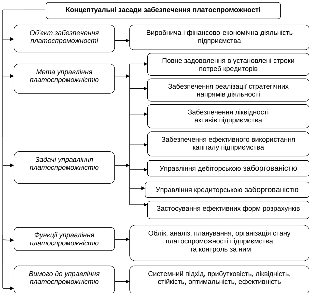
Рис. 3. Концептуальні засади забезпечення платоспроможності