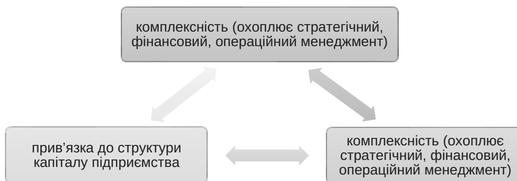
Рис. 1. Основні особливості фінансової стійкості