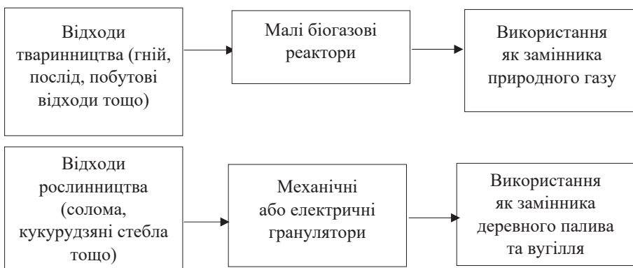
Рис. 2. Принципова схема переробки відходів сільськогосподарської діяльності в особистих селянських господарствах на біогаз та тверде біопаливо

На думку Мазур К.В., необхідною є інформаційна модель взаємодії сміттєперобних підприємств орієнтованих на виробництво біогазу, яка повинна включати взаємодію на засадах державно-приватного партнерства науково-дослідних установ та відповідних підприємств орієнтованих на виробництво біопалива [9, с. 68].