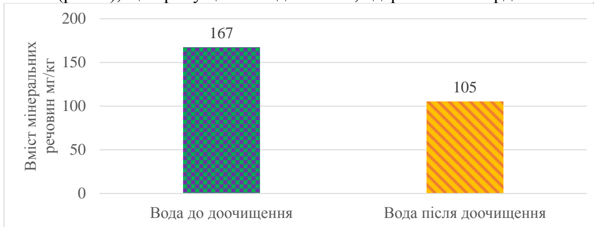
Рис. 2. Вплив фільтрації води на вміст в ній мінеральних речовин

Коефіцієнт небезпеки важких металів у доочищеній криничній воді не перевищував пороговий рівень 1,0 і був нижчий даного показника по Pb у 1,66 раз, Cd – у 5,88 раз, Zn – у 5,5 раз та Cu – у 32,2 раз. Результати досліджень показали (рис. 2), що пропущення води питної, одержаної зі свердловини через