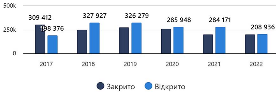
Рисунок 1 – Динаміка ФОПів в Україні