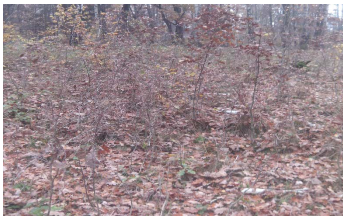
Рис. 3. Ділянка з природного поновлення дуба на зрубі в умовах Дашівського лісництва філії «Дашівське ДЛМГ»

Інформаційні дані щодо наявності природного поновлення дуба звичайного в лісових масивах лісництв в умовах філії «Дашівське ДЛМГ». За показниками таблиці 5, природне поновлення дуба звичайного виявлене ділянці зрубу дуба звичайного у свіжій грабово-ясеневій діброві (рис. 3).