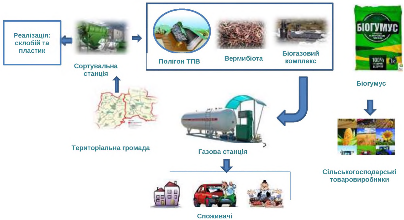
Рис. 1. Модель територіального кластера орієнтованого на виробництво біогазу з відходів підприємств і домогосподарств (на базі полігонів твердих побутових відходів)