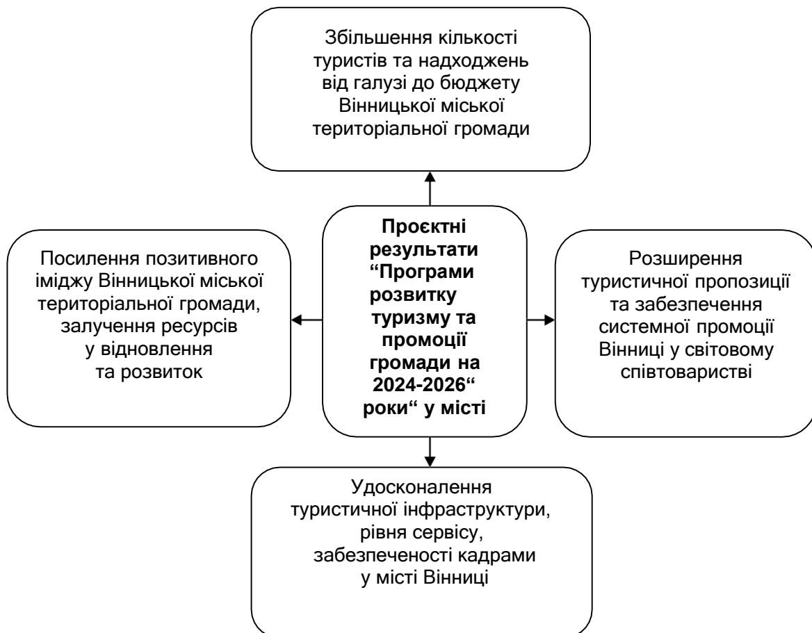
Рис. 2. Проектні результати “Програми розвитку туризму та промоції громади на 2024–2026 роки” у місті Вінниці

Проаналізовано життєвий шлях особистей, які продовжили закони та настанови “Пласту” – Національної скаутської організації України під час російсько-української війни та подвиг Героїв, які віддали життя за свободу та Незалежність України, а саме: Степан