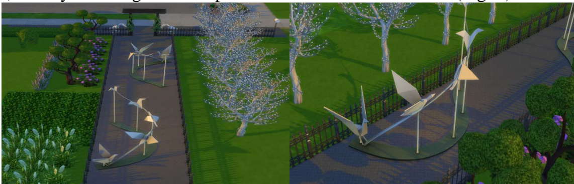
Fig. 5. Alley of the VNAU Botanical Garden. Sculpture in the form of birds

Easel painting. It is characterized by metaphorical meaning, symbolism and deep psychology. The size of such statues is close to the natural dimensions of the sample object, so they are designed to be perceived from a short distance (Fig. 5).