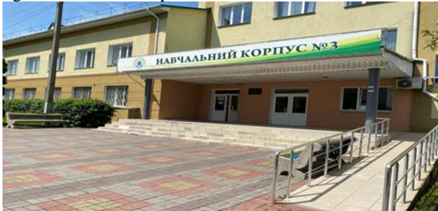
Fig. 3. Small architectural forms of utilitarian character