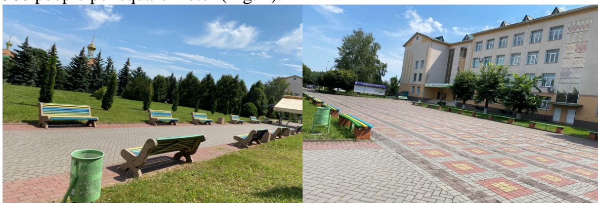
Fig. 2. Benches and litter bins in the park area

Stairs, ramps, retaining walls, and bridges are important elements of the park's road network and architectural design. According to construction standards, stairs with step sizes of 40-44 cm are convenient. And the size of the sub-steps should be about 8-10 cm. As for the width of the stairs, it is determined by the parameters of the adjacent elements of the road network and is associated with a capacity of no more than 500 people per square meter (Fig. 2).