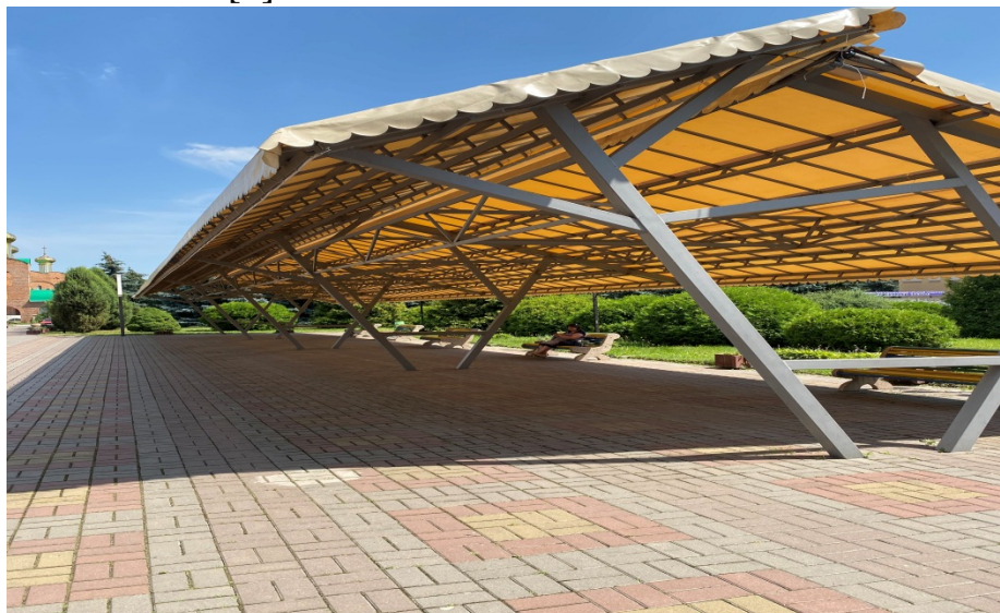
Fig. 1. Benches and sheds on the campus

The benches on the campus are comfortable to use. Their shape is simple, and the color scheme organically fits into the overall color scheme of the territory of the higher education institution [7].