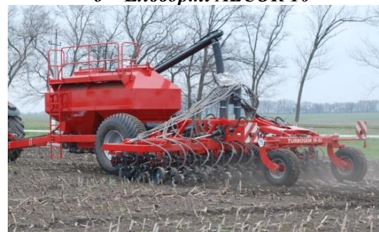
г – Агро-Союз Turbosem II 19-32