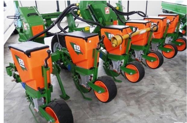
г – Amazone ED