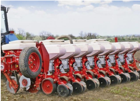
в – VEGA 8 PROFİ