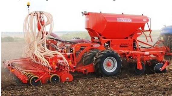
а – Gaspardo PE 300

Роздільно-агрегатні сівалки складаються з окремих блоків, сполучених у єдиний агрегат (рис. 3), до них відносяться: Gaspardo PE 300 [15], Ельворті ALCOR 10 [15], Newholland FlexiCoil, Great Plains STA-400 [15], Агро-Союз АТД, Агро-Союз Turbosem II 19-60 (32; 48) [15] та ін.