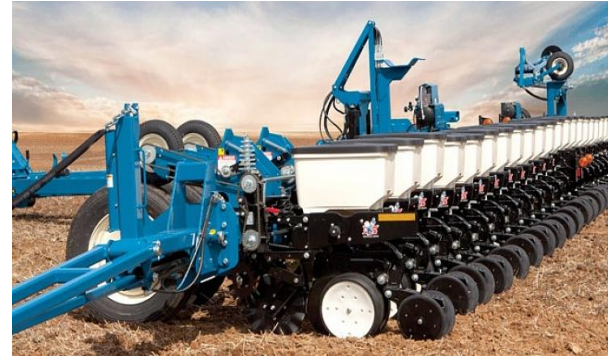
б – Kinze 3700