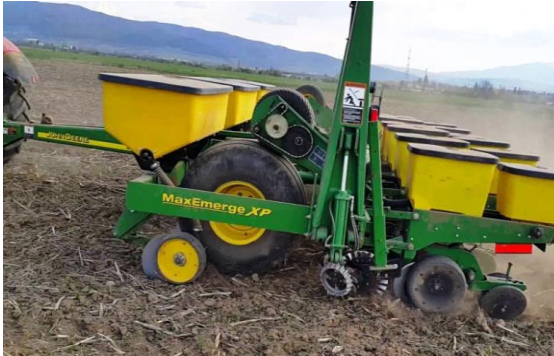
a – John Deere 1780

Секційні сівалки складаються з окремих посівних секцій, приєднаних до рами (John Deere DB [15], John Deere 1780 [15], Kinze 3700 [9], VEGA 8 PROFİ [15], Amazone ED [15]). Кожна секція забезпечена бункером, висівним апаратом, механізмом приводу, сошником, опорними колесами, котками і загортачами (рис. 4). Переміщенням секцій по рамі можна змінювати ширину міжрядь. Таке компонування характерне для спеціальних сівалок.