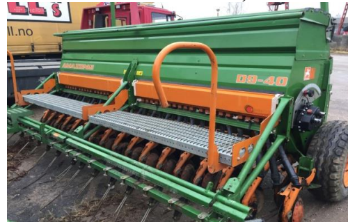
г – Amazone D9-40