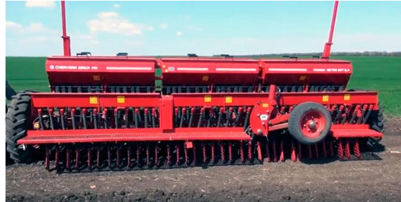
б – ASTRA 5,4