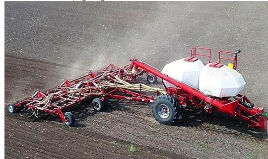
б – Ельворті ALCOR 10