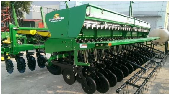
в – Great Plains 2000