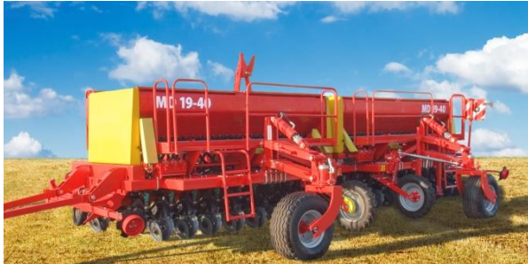
а – Агро-Союз MD 19-40

Моноблочні сівалки обладнані загальною рамою, на якій змонтовані всі робочі органи (рис. 2), зокрема це такі як: Агро-Союз MD 19-40 [15], ASTRA-5,4 [15], Great Plains 2000 [15], Amazone D9-40 (60) [15], Gaspardo MOD M [15], та ін. Недоліками сівалок цієї групи є значна матеріалоемність на 1 м ширини захвату (550...1300 кг) та підвищений тяговий опір.