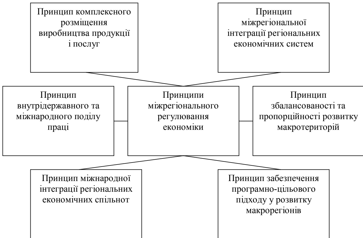
Рис. 3. Структура принципів міжрегіонального регулювання економіки

Принцип збалансованості та пропорційності розвитку і розміщення виробництва передбачає дотримання рівноваги між виробничими потужностями і обсягом виробництва на великих територіях, з одного боку, і наявністю сировинних, паливно-енергетичних, трудових, сільськогосподарських макрорегіонів – з іншого, а також між виробничою і соціальною сферами.