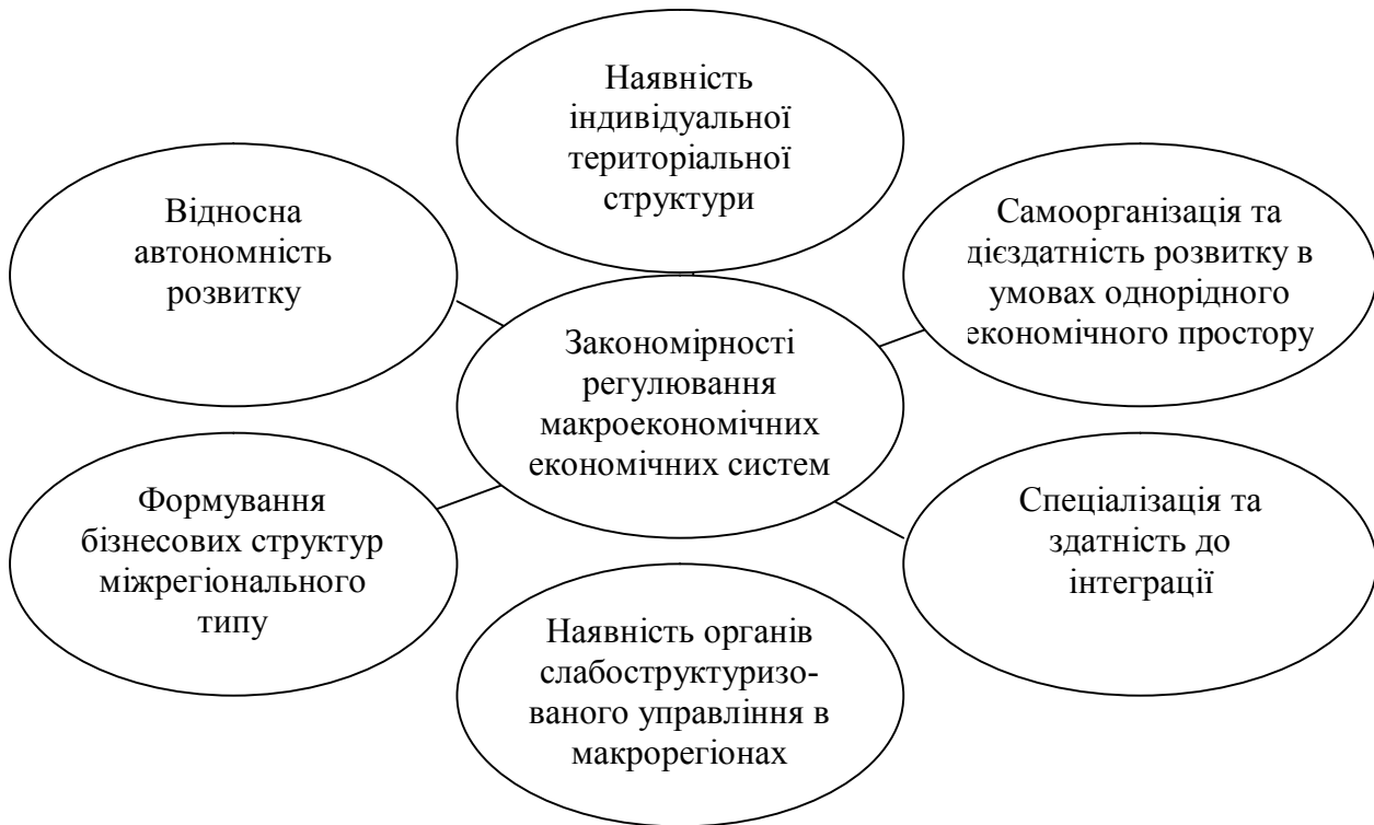
Рис. 2. Основні закономірності регулювання міжрегіональної економіки

Наявність індивідуальної територіальної структури виходить із виробничо-господарської спеціалізації макрорегіонів. Наприклад, Донбас спеціалізується на гірничо-рудній промисловості, Поділля - на виробництві і переробці сільськогосподарської продукції, Карпатський економічний район – на природно-рекреаційній діяльності і т.п.