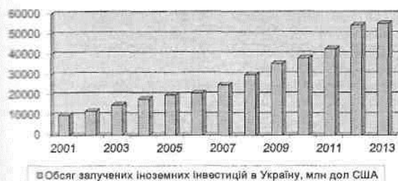
Рис. 1. Обсяги залучених прямих іноземних інвестицій в Україну за 2001-2013 роки

Погіршення інвестиційного клімату спричинило зміну темпів залучення прямих іноземних інвестицій в економіку України. Основними інвесторами в АПК України, зокрема у агропромисловість, є: Кіпр ($251,2 млн), Велика Британія ($133,5 млн), Данія ($57,6 млн), Німеччина ($55,4 млн), Польща ($29,3 млн), Австрія ($28,9 млн). Загалом, об'єм прямих іноземних інвестицій в сільське господарство України станом на 01.07. 2012 р. склав 739,0 млн. дол. США, а і це 1,4% від загального об'єму інвестицій в економічну діяльність країни [1]. Аналізуючи тенденції останніх років, можна стверджувати, що обсяг залучених іноземних інвестицій в Україну залишається незначним (рис. 1).